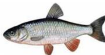
Гонавлъ Squalius cephalus