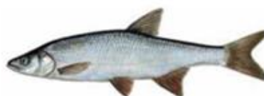
Жерех* Aspius aspius