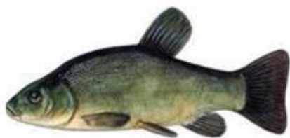
Линь Limea limea