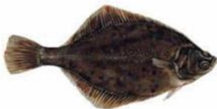
Речная камбала Platichthys flesus