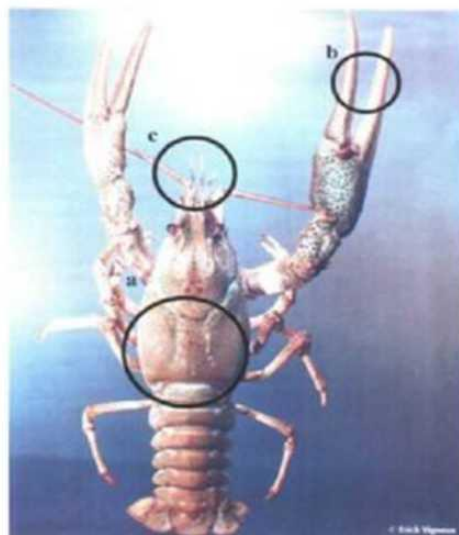
Изображение 3. Узкопалый рак

4. Колючещекий рак ( Orconectes limosus ) (изображение 4):