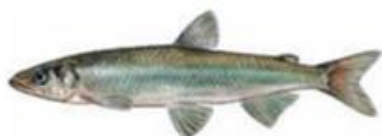
Корюшка Osmerus eperlanus