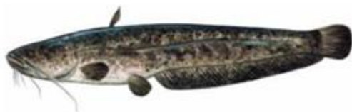
Сом* Silurus glanis