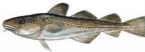
Треска Gadus morhua