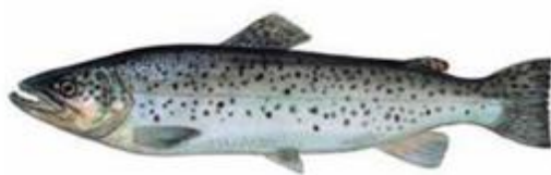
Кумжа* Salmo trutta