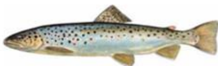
Ручьевая форель Salmo trutta f.