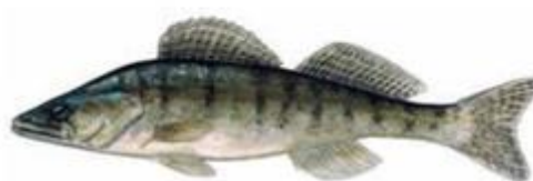
Судак Sander lucioperca