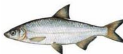
Рыбец Vimba vimba