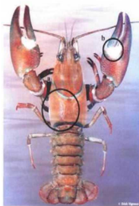
Изображение 2. Сигнальный рак

3. Узкопалый рак ( Astacus leptodactylus ) (изображение 3):