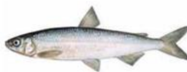
Ряпушка* Coregonus albula