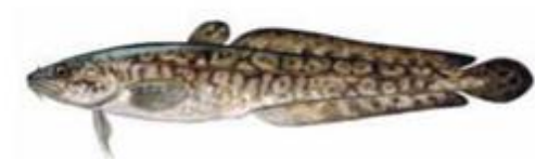
Налим Lota lota