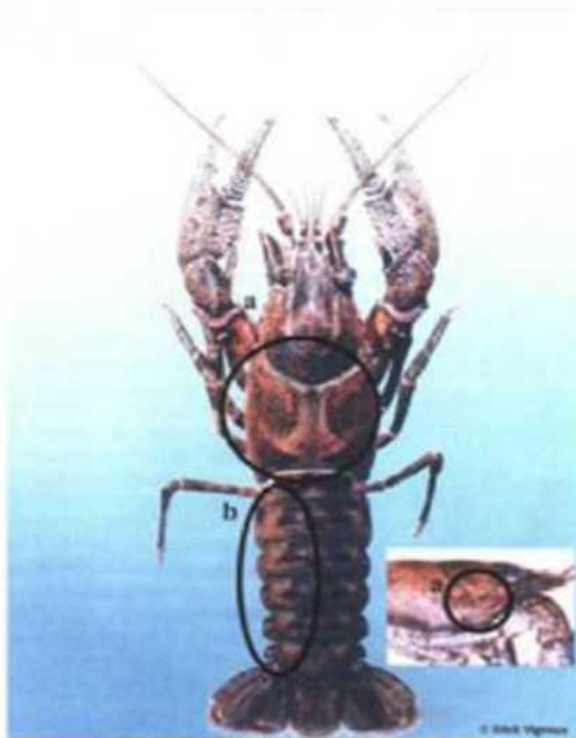
Изображение 4. Колющещекый рак

4.2. красно-коричневые полосатые пятна на поверхности сегментов брюшной части (указание "b") (отличие от узкопалого рака).