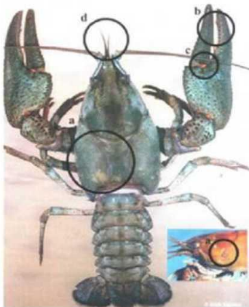
Изображение 1. Широкопалый рак